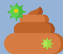
Примеси в кале