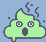
Изменение цвета кала