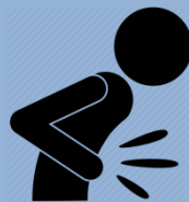
Боль в животе